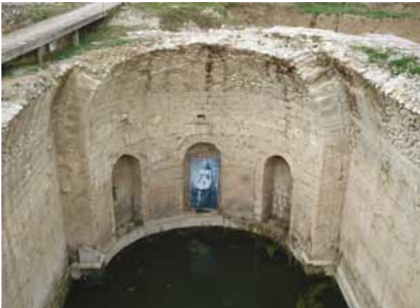
Allianoi mimari yapılarından birine örnek.

Kızılderililerin, “Biz bu dünyayı çocuklarımızdan ödünç aldık!” sözünü unutmamalıyız. Bir gün dünyanın herhangi bir yerinde, bir yabancının, “Siz, Allianoi'nin çamurlara gömülerek yok edildiği ülkedensiniz, değil mi!” şeklindeki ağır ve haklı suçlamasıyla karşılaşmak istemiyoruz. Bu utancın ne bize ne de çocuklarımıza yaşatılmasına izin veremeyiz.