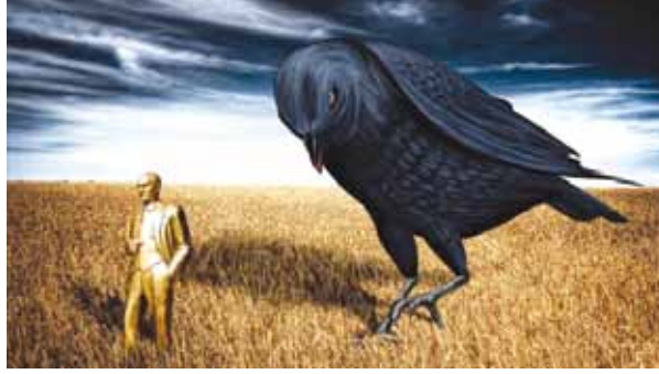
Saldırıya uğrayan “Ekstramücadele” sergisinden bir çalışma.

içinde yaşanan kültür oluşturmaktadır. Toplumda, şiddetin, sorun çözmek amacıyla baş vurulabilecek bir davranış olduğunun kabul görmesi, şiddet kullanımını kolaylaştırmaktadır. Ülkemizde kadın ve çocuklara yönelik şiddetin sokakta, ailede, okulda hatta hukuksal alanda kabul ve müsamaha gördüğü bir kültür içinde yaşıyoruz. Şiddeti ‘meşru görme’ mantığını anlamak için, ülkemizde yaygın kültürel inancı ifade eden ‘uslanmayanın hakkı kötektir’ sözünü