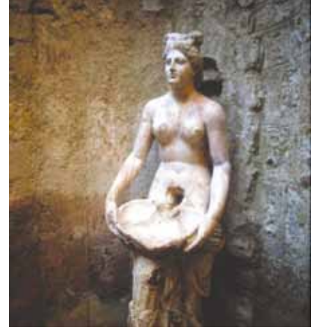
Allianoi buluntusu Roma Dönemi'ne ait Nymph.

Uzmanlarca, doğanın bağrında mükemmel bir şekilde korunmuş olduğu gözlemlenen bu önemli antik kentin salt %20'si gün yüzüne çıkarılabilecek durumdadır. Kazılmayı bekleyen büyük bölümde çok önemli bilgi ve bulgulara