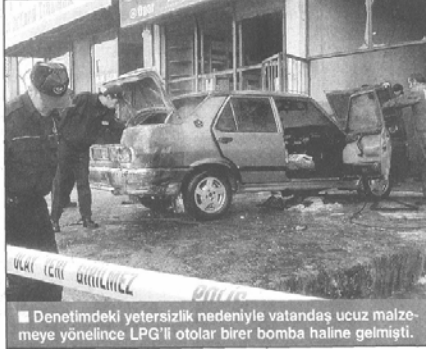
■ Denetimdeki yetersizlik nedeniyle vatandaş ucuz malzeme yöneline LPG'li otolar birer bomba haline gelmişti.

star 'ın yaşanan facialar üzerine gündeme getirdiği LPG'li araçların denetimindeki yetersizlik, son buluyor. Bakanlık bu tür araçların son kontrollerini yapma yetkisini yeniden Makine Mühendisleri Odası'na devretti