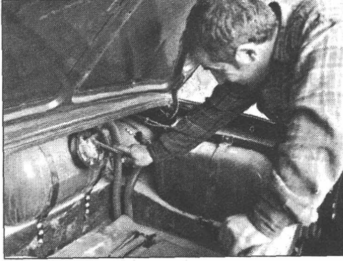
8 Nisan 2005 Vakıf