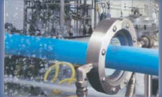
Paslanmaz çelik süper havalı yuvarlak temizleme bıçağında ve ilaç uygulamaları için idealdir.