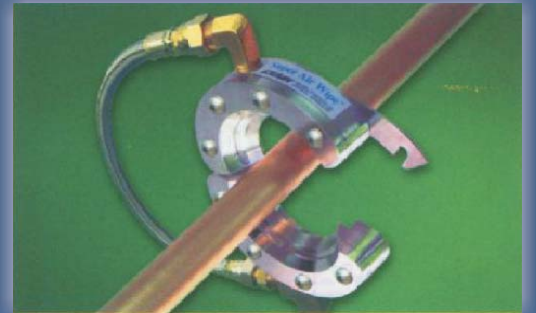
Süper havalı yuvarlak temizleme bıçağın bölünmüş tasarımı kolayca açılır ve dış açma ihtiyacını yok eder.