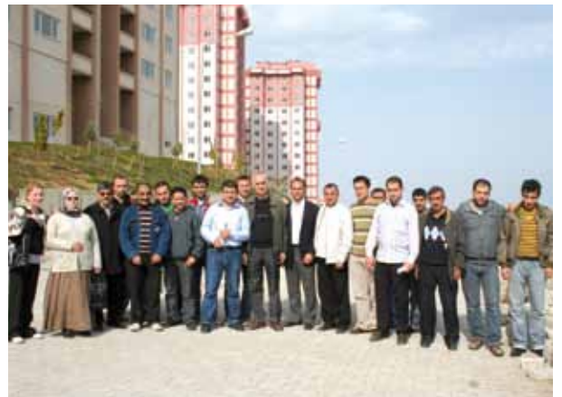
Gaziemir TOKİ konutları.