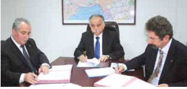
Bayraklı Belediyesi Asansör Yıllık Kontrol Protokolü