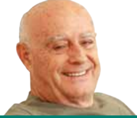
Av. Turgut Kazan