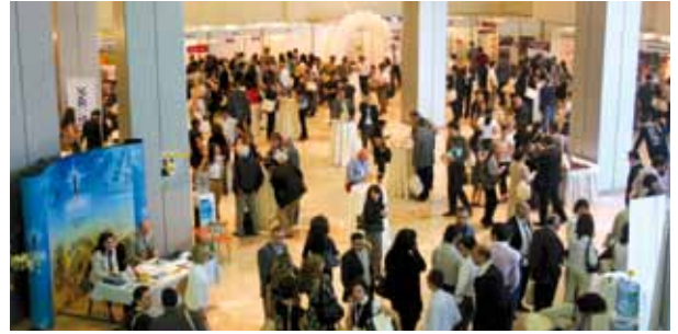
Kalder tarafından düzenlenen "11. Mükemmelliği Arayış Sempozyumu"