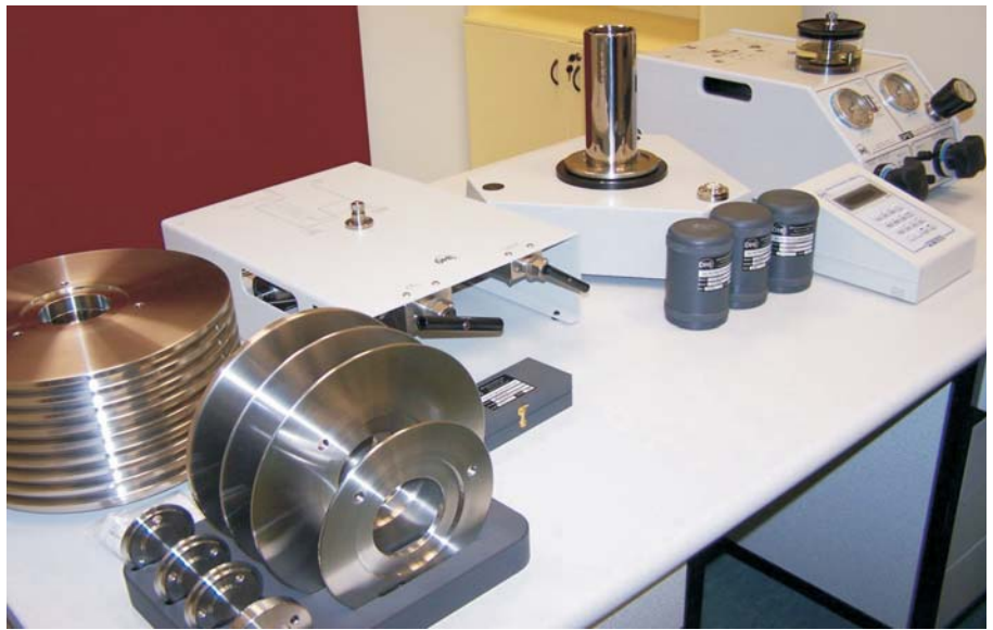
Şekil 2. TÜBİTAK UME Yüksek Basınç Laboratuvarında 500 MPa Çalışma Aralığına Sahip Pistonlu Basınç Standardı

Günümüz teknolojik gelişmelerinin sonucu olarak pistonlu