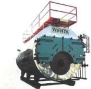
Skoç Buhar Kazanları