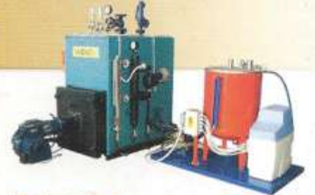
Paket Buhar Jeneratörleri