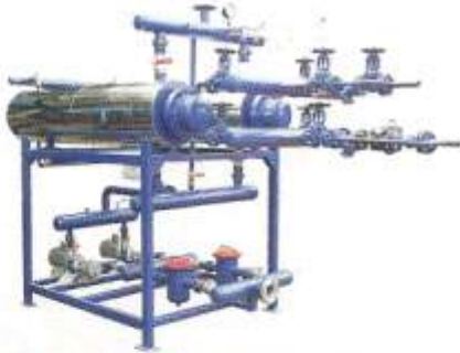
Fuel Oil Ring İstasyonları