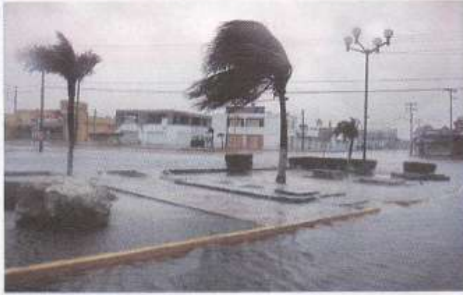
Özellikle Meksika'da etkili olan 'wilma' kasırgasından görüntüler

Tüm kasırgalara isim verilir ama neden? Tabii ki onlar okyanus boyunca hareket ederken rahatça takip edilebilirler diye. Çünkü aynı anda birden çok kasırga olabilir ve eğer onlar adlandırılmazlarsa hangi fırtına hakkında konuşulduğu karıştırılabilir.