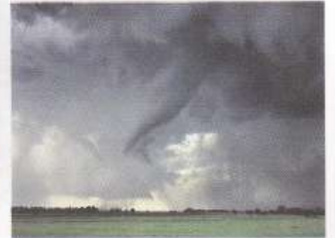
"Katrina" başlarken çekilen fotoğraflar