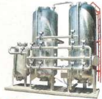
Su Yumuşatma Cihazları