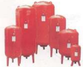
Hidrofor ve Genleşme Tankları

Buhar ve Kızgın Yağ Sistemleri Danışmanlığı