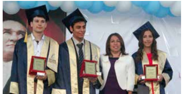
CBÜ Makina Mühendisliği.