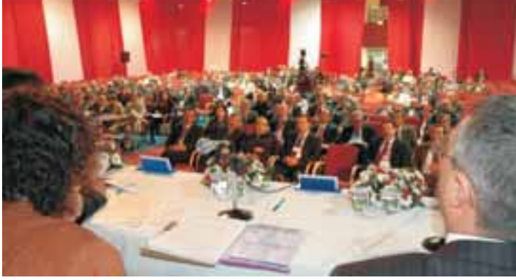
Teskon kongre salonunda katılımcılar sunumları dikkatle izledi.