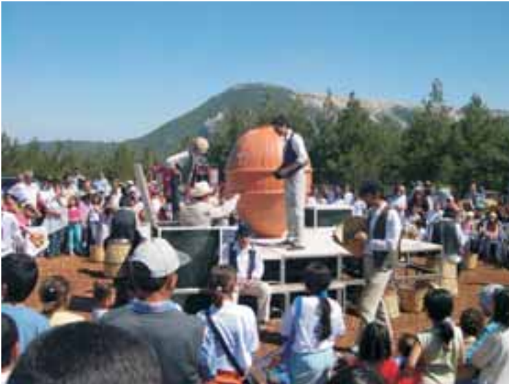
Küp Karaelmas festivalinde

Kentin Oyuncuları, kostüm, dekor ve teknik ekipmanlarını da kendi içinde oluşturabilen dinamik yapısıyla bu dönem için yeni oyunlarının çalışmasına başlamıştır.