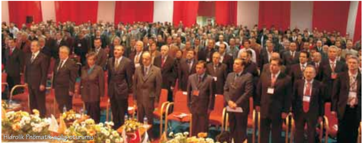
Hidrolik Pnömatik açılış oturumu

Oturumlarda hidrolik pnömatik alanında bilimsel ve teknik ve AR-GE kapsamında sektörde yapılan