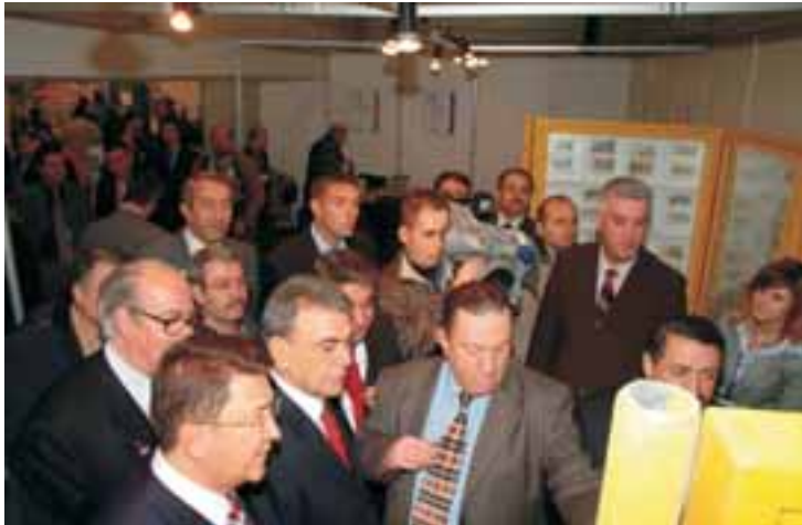
Pul sergisi ilgi gördü.

hizmet üreten, temsilcilikleri ile birlikte 211 kuruluş katılmıştır. Kongreyi 1460'ı kayıtlı delege olmak üzere, 3.000'i aşkın mühendis, mimar, teknik eleman ile üniversite, meslek yüksek okulu ve meslek lisesi öğrencisi izlemiş, fuar da yaklaşık 15.000'i aşkın kişi tarafından ziyaret edilmiştir.