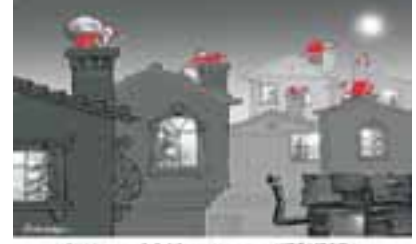
2006, meclisten gelmiş / HERKESE!