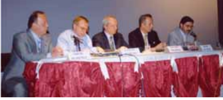
Akhisar'da "Doğal gaz merhaba" paneli

Şubemiz bu dönem Aliağa, Akhisar, Soma, Turgutlu, Salihli, Ödemiş İlçe Temsilcilikleri ve Bergama, Dikili, Alaşehir ve Tire Mesleki Denetim Büroları ile etkinlik alanındaki çalışmalarını sürdürmüştür. Bu temsilciliklerde mekanik tesisat, araç proje tadilat ve asansör projeleri mesleki denetim çalışmaları yürütülmüş, LPG sızdırmazlık testleri yapılmış, periyodik kontrol hizmetleri verilmiştir. Tire ve Soma'da yerel yönetimlerle yapılan görüşmeler sonucunda yeni binalarda kalorifer tesisatı projesi hazırlanması zorunluluğu getirilmiştir.