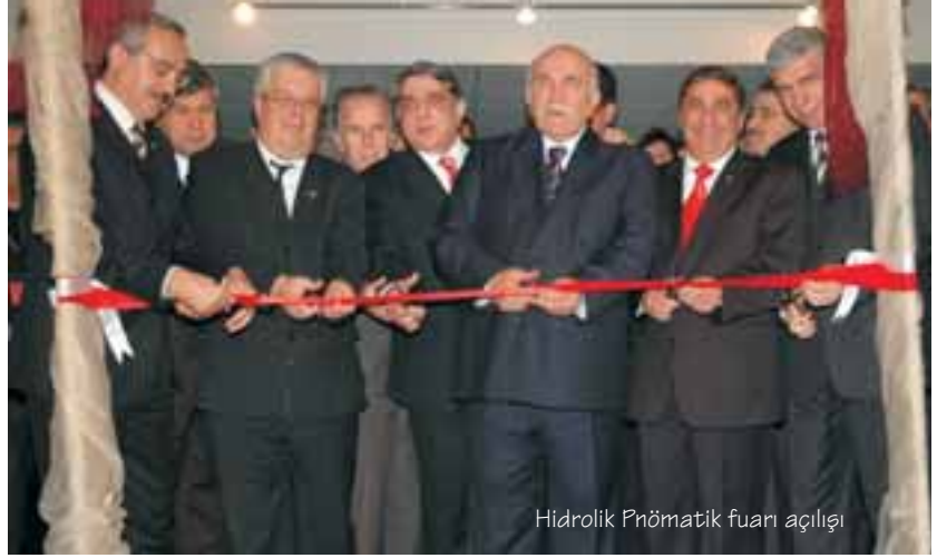
Hidrolik Pnömatik fuarı açılışı

Kongre 44 kurum ve kuruluş, ve sektörel basın kuruluşu tarafından