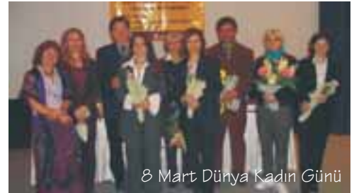
8 Mart Dünya Kadın Günü