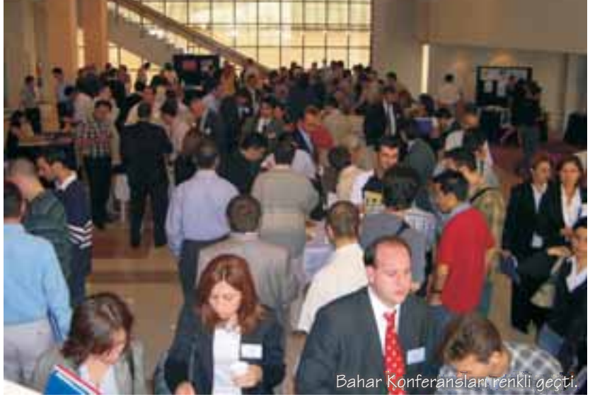
Bahar Konferansları renkli geçti.

Şubemizce 7- 8- 9 Ekim 2004 tarihlerinde gerçekleştirilen Endüstri Mühendisliği Bahar Konferansları 'nda “Verimlilik ve ERP” konusu ana tema olarak ele