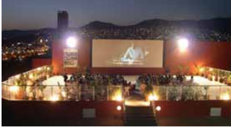
Tepekule Açık hava Sinema Şenliği