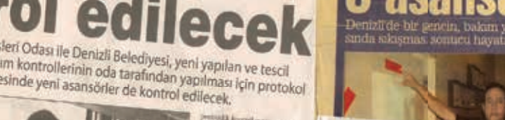
Denizli Makina Mühendisleri Odası, yeni yapılan asansörlerin bakım kontrollerini üstlenecek.

Denizli Makina Mühendisleri Odası ile Denizli Belediyesi, yeni yapılan ve tescil edilecek asansörlerin bakım kontrollerinin oda tarafından yapılması için protokol imzaladı.