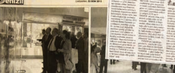
TMMOB haftası etkinlikleri kapsamında düzenlenen konferans, katılımcıların ilgisini çekti.