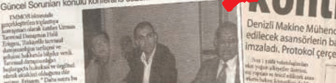
TMMOB haftası etkinlikleri kapsamında düzenlenen tarımsal danışmanlık konferansı, katılımcıların ilgisini çekti.

TMMOB haftası etkinlikleri kapsamında Tarımsal Danışmanlık ve Güncel Sorunları konulu konferans düzenlendi.