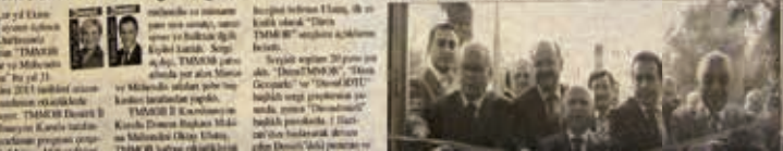
"Diren-TMMOB" sergisi, TMMOB haftası etkinlikleri kapsamında düzenlendi.

TMMOB Haftası etkinlikleri kapsamında, Makina Mühendisleri Odası Sergi Salonu'ndaki "Diren-TMMOB" konulu sergide, gezi direnişi süresince yapılan eylemlerden fotoğraflar yer alıyor.