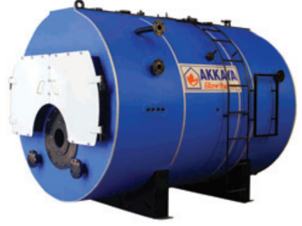
SIVI GAZ YAKITLI BUHAR KAZANLARI

20 den fazla ülkeye ihracatımızla Türkiye'nin kazan sektöründeki hakkı gururuyoruz.