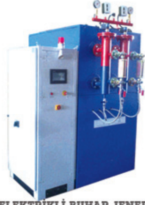
ELEKTRİKLİ BUHAR JENERATÖRLERİ

TSE - CE - ISO 9001-2008 kalite belgeleri.