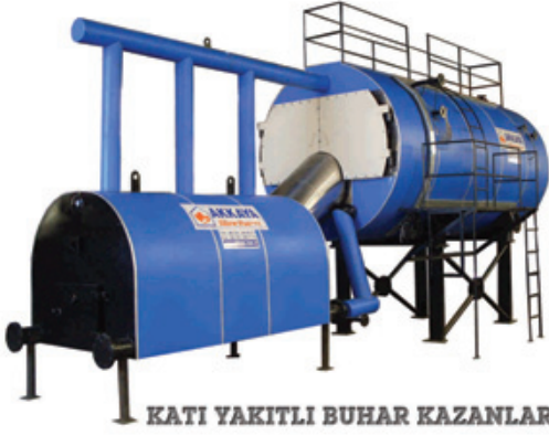
KATI YAKITLI BUHAR KAZANLARI