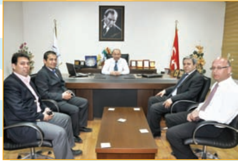
▲ Bera Otel Konya