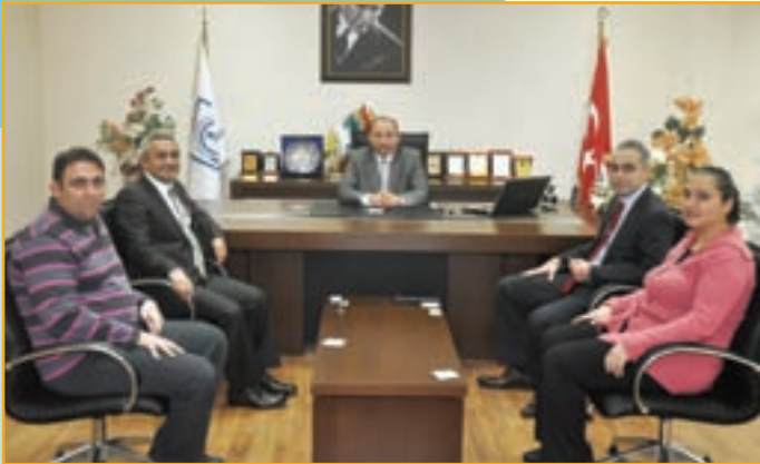
▲ İş Bankası Konya Şubesi