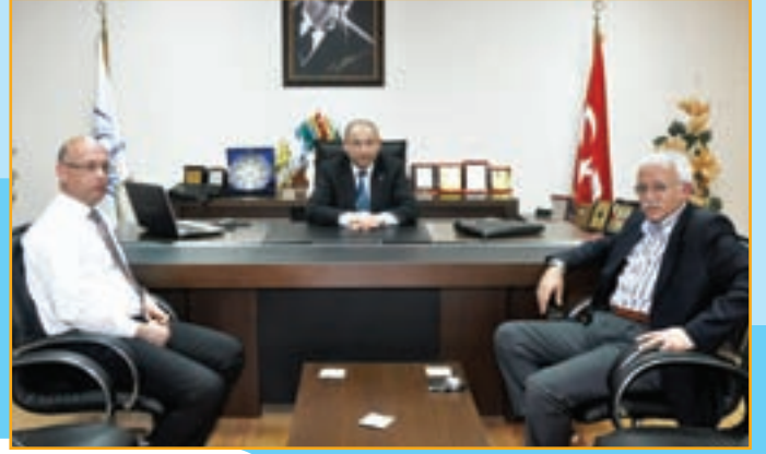
▲ AKP Konya Milletvekili Cem Kozlu